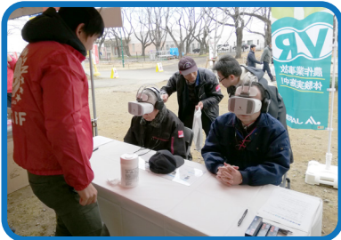
JAまつりなどのイベント